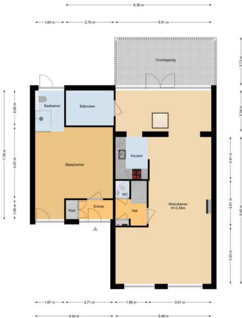
Mokkabruin 6 | Zoetermeer Begane Grond

De plattegronden zijn geproduceerd voor promotionele doeleinden en ter indicatie. Aan de plattegronden kunnen geen rechten worden ontleend. www.woonkeur365.nl