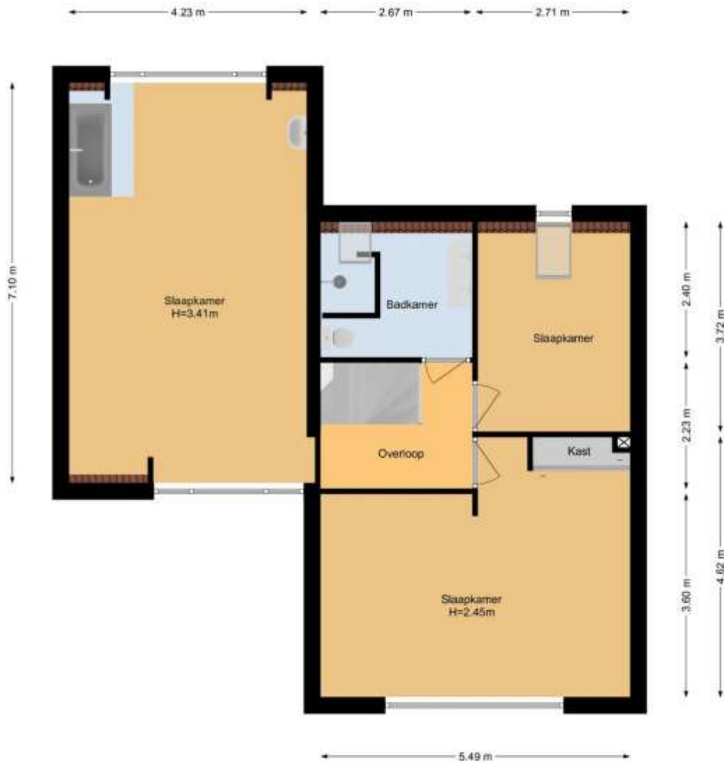
Mokkabruin 6 | Zoetermeer 1e Etage

De plattegronden zijn geproduceerd voor promotionele doeleinden en ter indicatie. Aan de plattegronden kunnen geen rechten worden ontleend. www.woonkeur365.nl